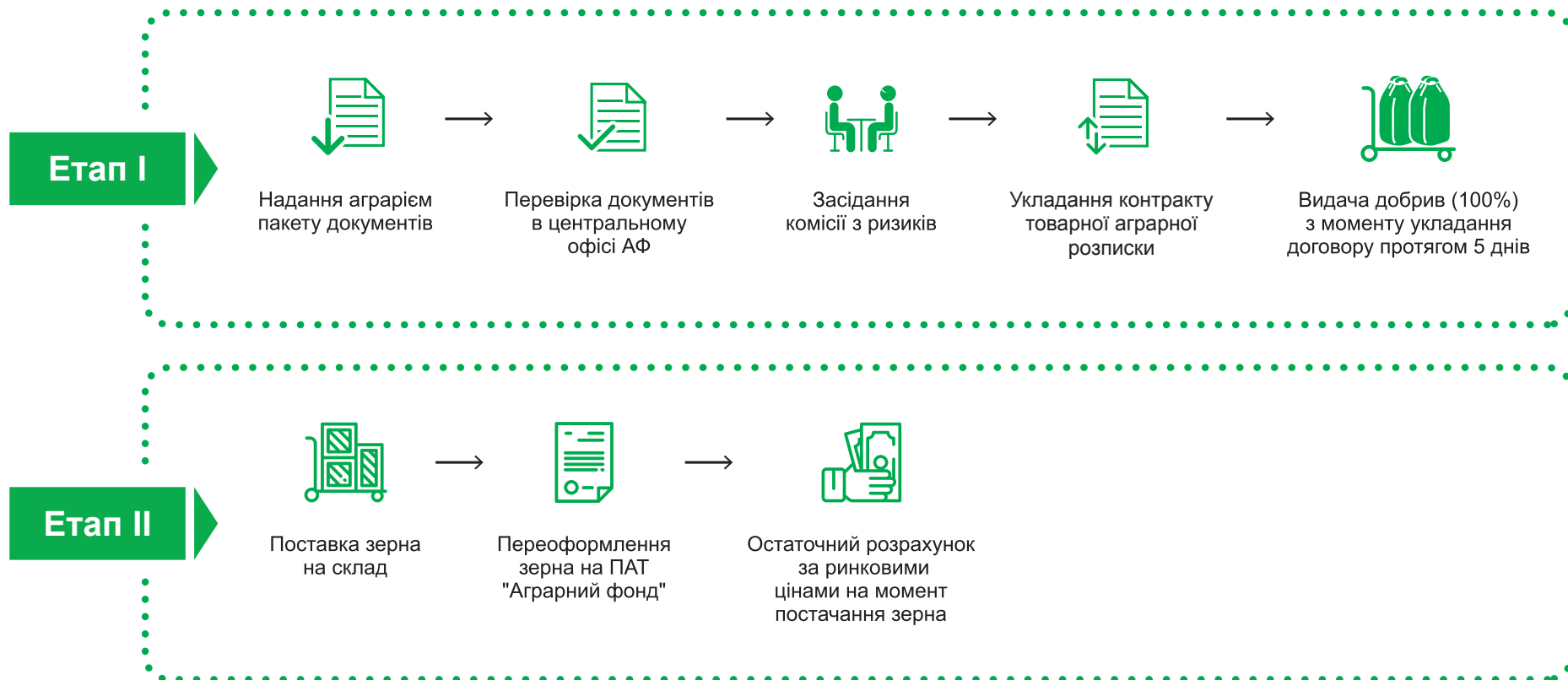
Схема заключення контракту поставки зерна врожаю 2020 року